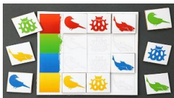
Рис. 2. Дидактическая игра «Подбери по цвету»

— формирование представлений о внешних свойствах предметов - форме, цвете, величине, положении в пространстве (рис. 2);