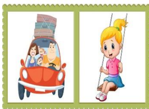
Рис. 5. Дидактическая игра «Исправь предложение»