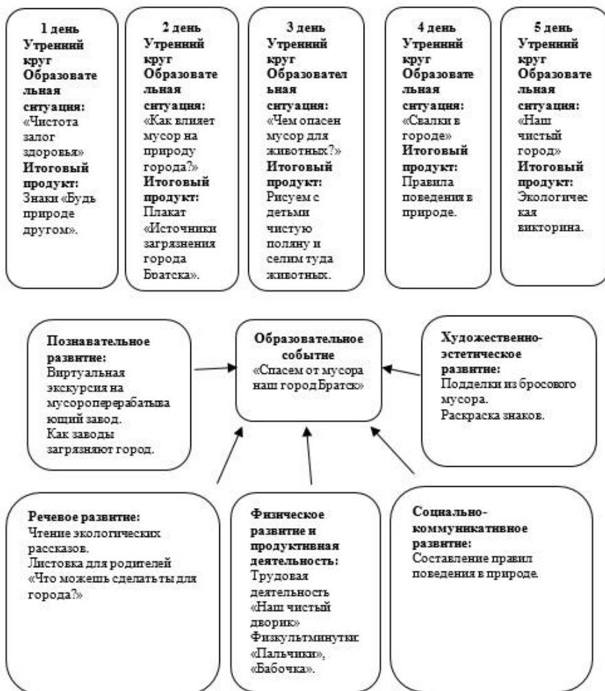
Рис. 1. Ресурсная карта экологической акции «Спасем от мусора наш город»

В ходе работы по данной теме были составлены ресурсные карты экологических акций (рис. 1, 2), где каждая акция проходит под своим девизом, имеет наглядную агитацию (листовки, плакаты, памятки), а в содержании акций входят праздники, развлечения, викторины, выставки, конкурсы, посвящённые объектам акции и другие формы работы с детьми и родителями.