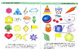
Рис. 4. Дидактическая игра «Запомни и назови»

— развитие познавательных процессов - памяти, внимания, мышления (рис. 4);