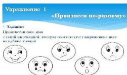
Рис. 3. Дидактическое упражнение «Произнеси по-разному»

— создание положительного эмоционального настроения (рис. 3);