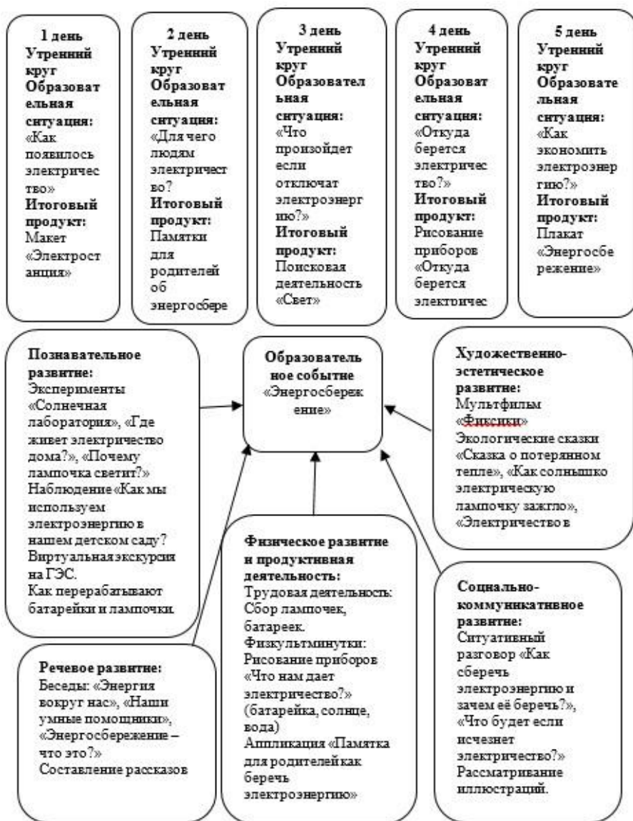
Рис. 2. Ресурсная карта экологической акции «Энергосбережение»

Таким образом, данная деятельность направлена на создание условий развития ребенка, открывающих возможности для его успешной социализации, всестороннего личностного развития. Все